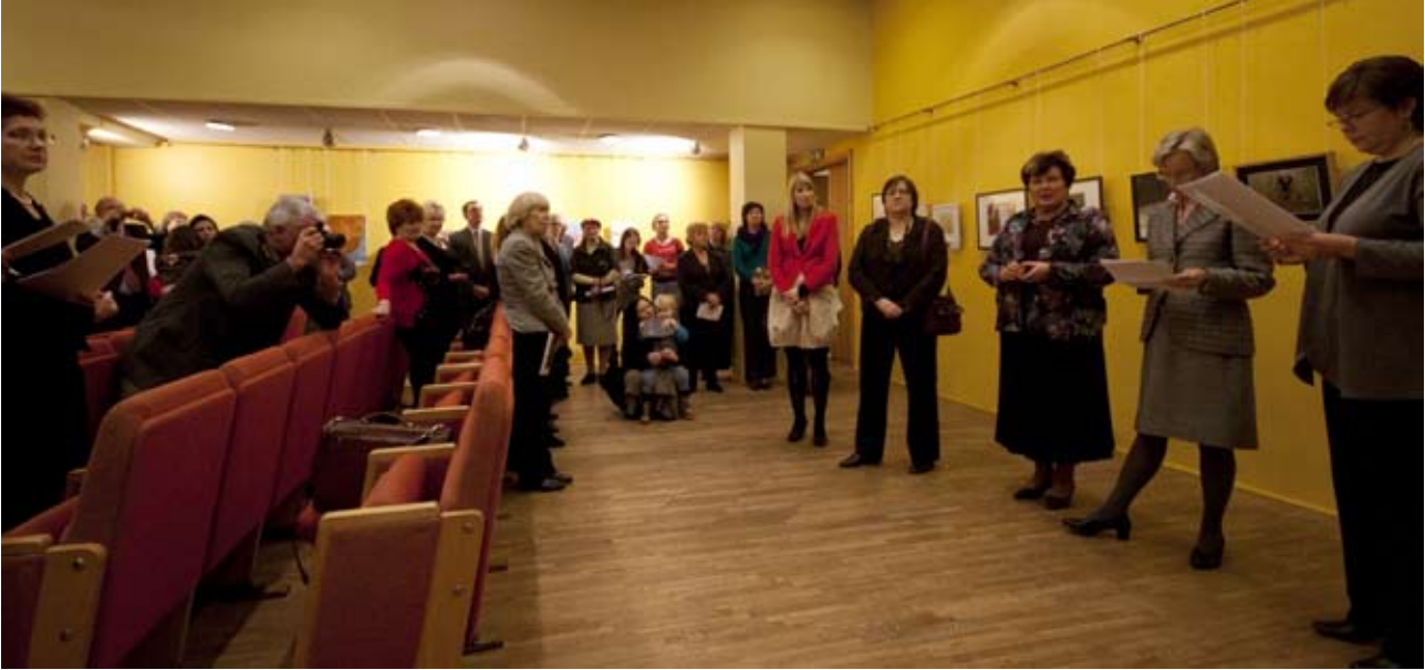
Karvanlähtöaika-kiertonäyttelyn avajaiset Riian yliopiston akateemisessa kirjastossa.

tammikuussa 2012 jälleen Viroon. Vuoden 2012 aikana näyttely on ollut Suomen Viron-instituutin organisoimana esillä useissa kirjastoissa, kulttuuritaloissa ja gallerioissa eri puolilla Viroa.